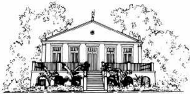
MCT/MUSEU PARAENSE EMÍLIO GOELDI