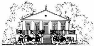
MCT/MUSEU PARAENSE EMÍLIO GOELDI