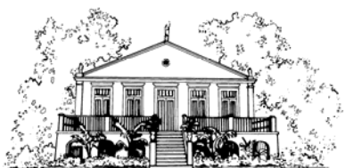
MCT/MUSEU PARAENSE EMÍLIO GOELDI