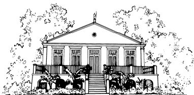
MCT/MUSEU PARAENSE EMÍLIO GOELDI