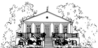
MCT/MUSEU PARAENSE EMÍLIO GOELDI