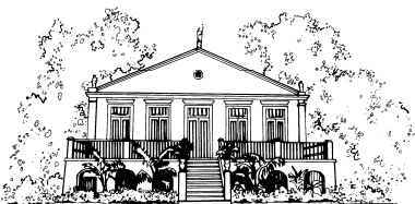
MCT/MUSEU PARAENSE EMÍLIO GOELDI