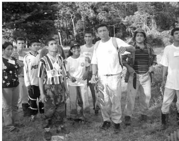
Figura 3. Em Caxiuanã, com alunos.

Em recente depoimento, P.Meir e Y. Malhi consideraram que “o trabalho do Samuel consolidou e incluiu a investigação