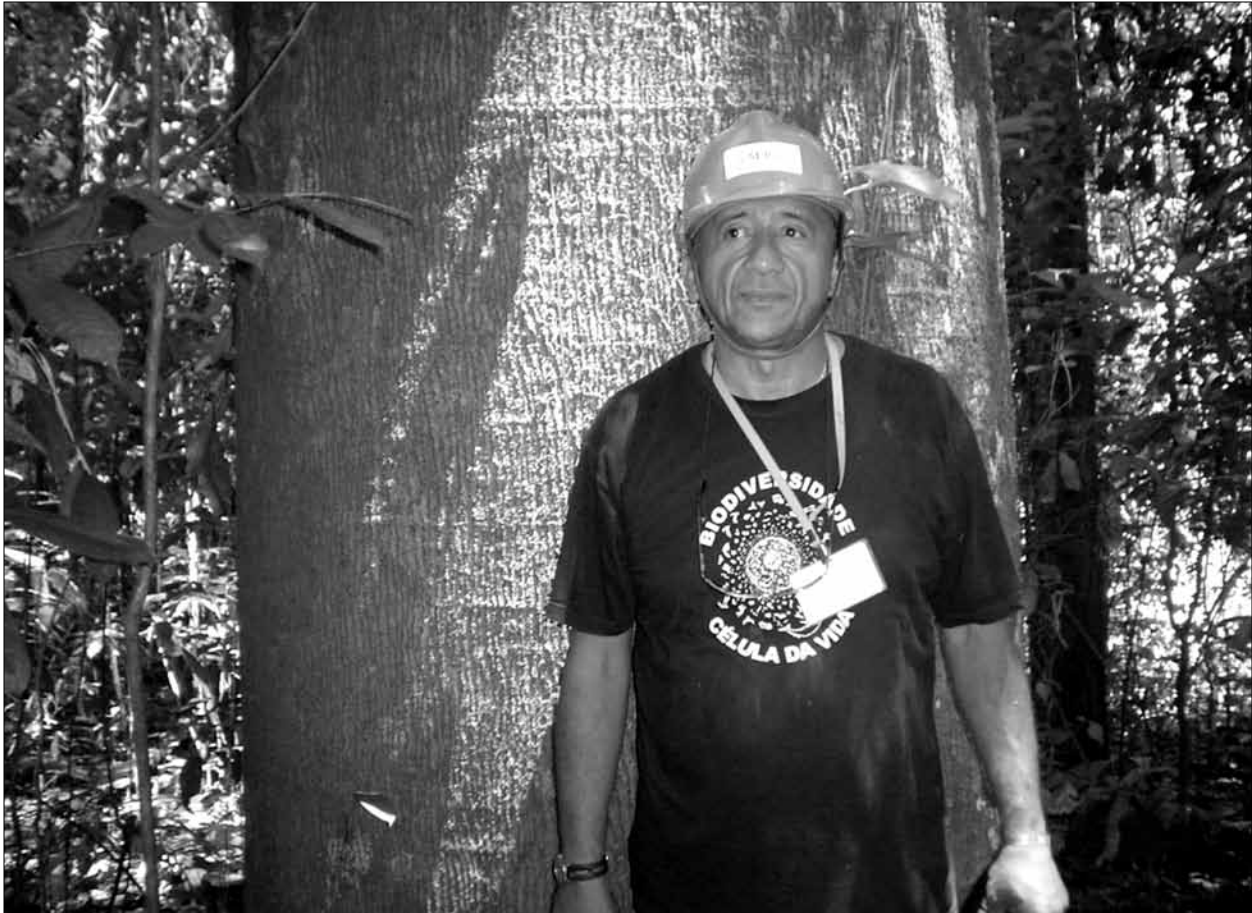
Figura 6. Em trabalho de campo.

florestal do MPEG em níveis de liderança internacional, e as parcelas a longo prazo que estabeleceu continuarão a ter um impacto no futuro”.