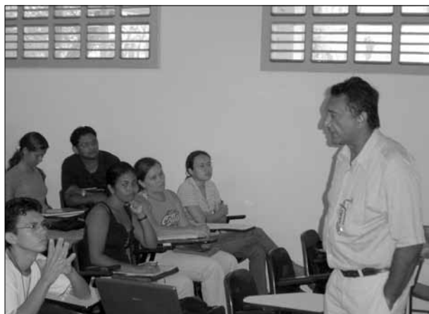
Figura 4. Em Caxiuanã, com alunos.